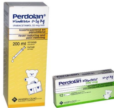
Koortswerend middel (bij voorkeur siroop)