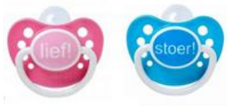
2 fopspenen (indien nodig)