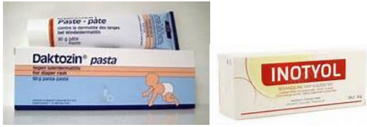
Luierzalf & specifieke verzorgingsproducten