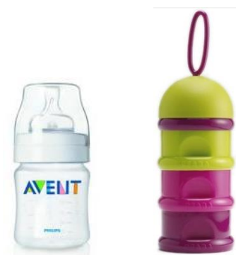
Flesjes met juiste hoeveelheid water + melkpoeder in verdeeldoosjes